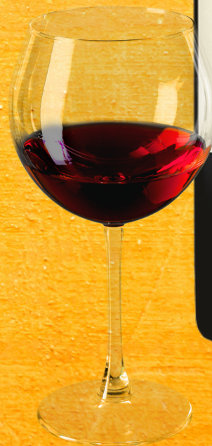
COPA DE VINO TINTO