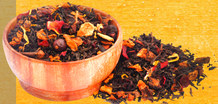
INFUSIÓN HERBAL - INMUNO ESTIMULANTE