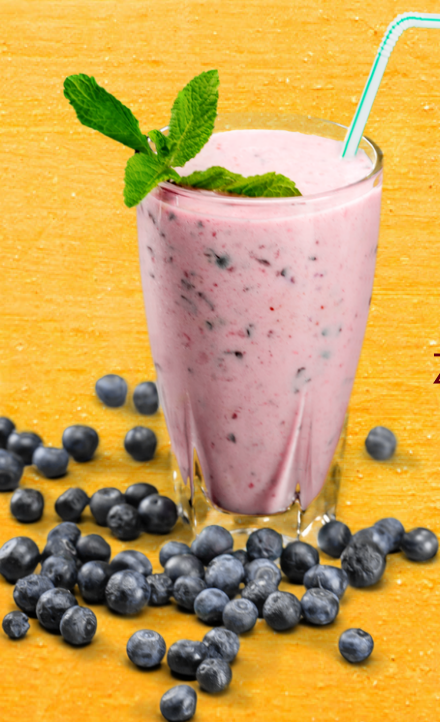
ARÁNDANOS, MENTA, AVENA Y BANOANO