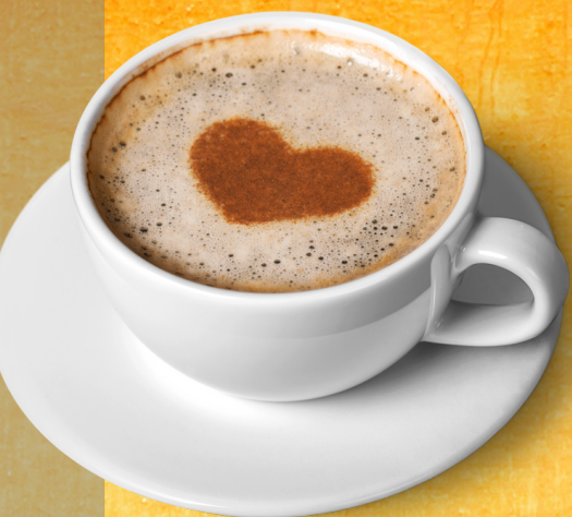
CAFÉ CON LECHE