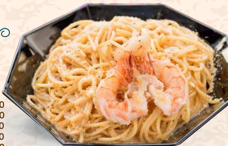
ALFREDO CON CAMARONES