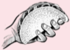
EL TACO DE CALLE